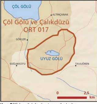
Uyuz Gölü önemli doğa alanı topografya haritası