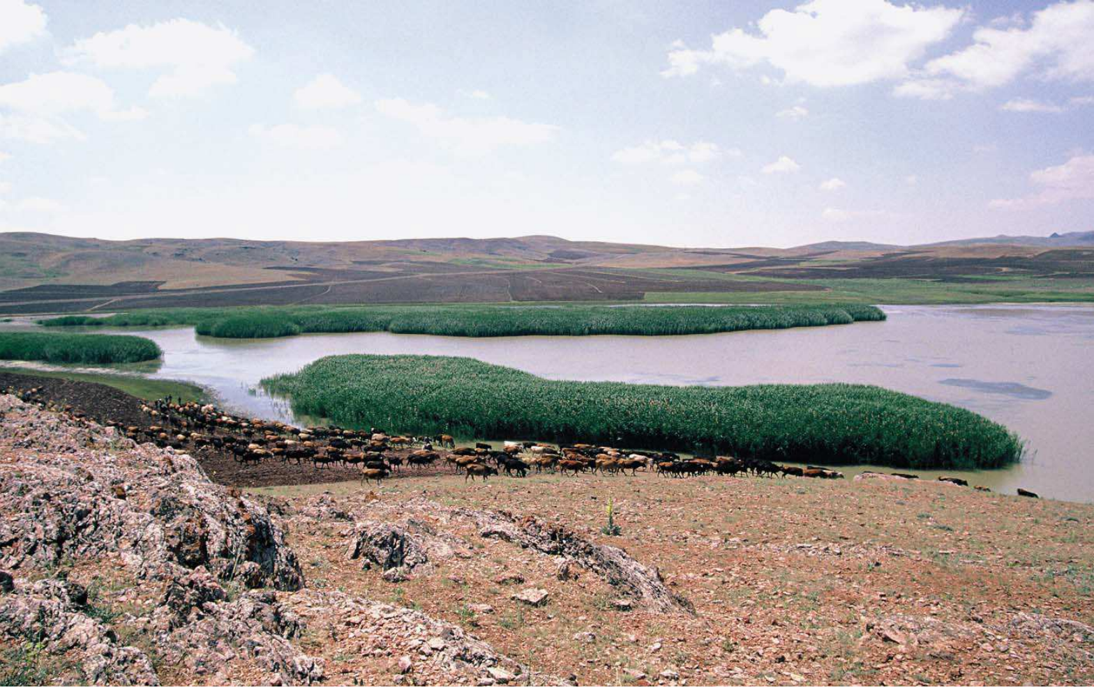
Uyuz Gölü

Yüzölçümü : 1077 ha Boylam : 32,93°D Enlem : 39,24°K Koruma Statüleri : Doğal sit alanı Yükseklik : 1160 m - 1260 m İl(ler) : Konya İlçe(ler) : Bala, Kulu