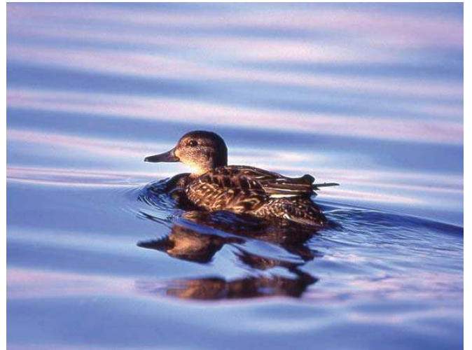
Çamurcun (Anas crecca)

■ Yerel İlgili Sahipleri Konya Valiliği; Konya İl Çevre ve Orman Müdürlüğü; Konya İl Kültür ve Turizm Müdürlüğü.