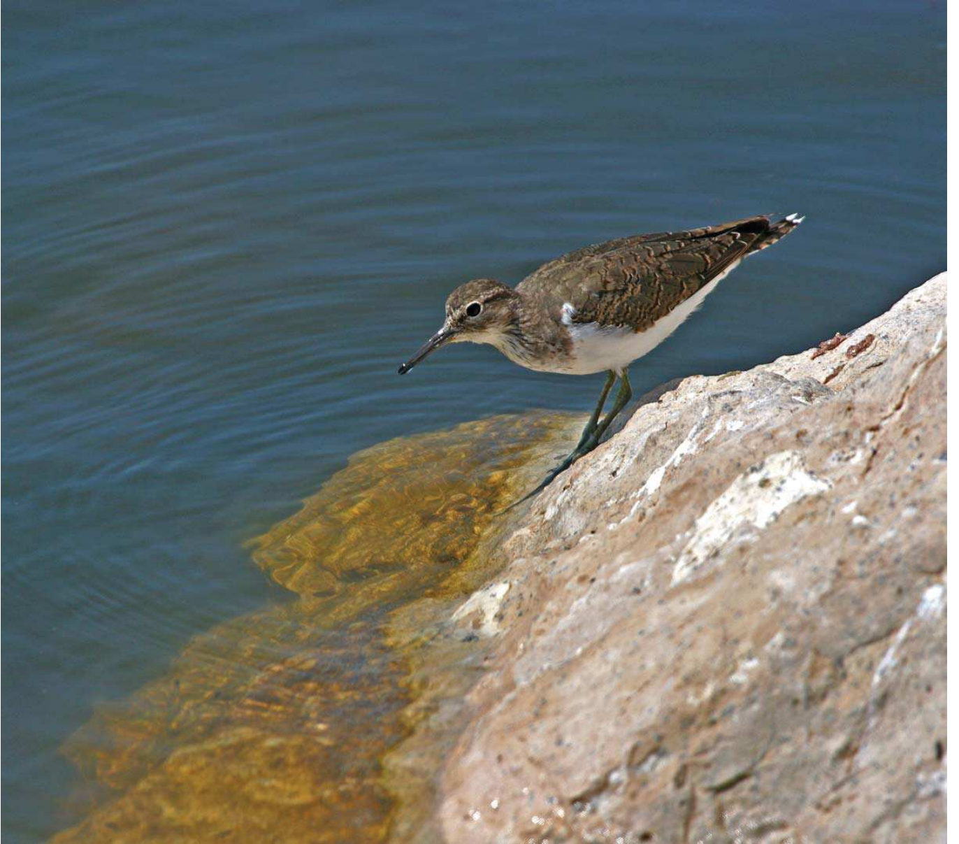
Dere düdükcünü ( Actitis hypoleucos )