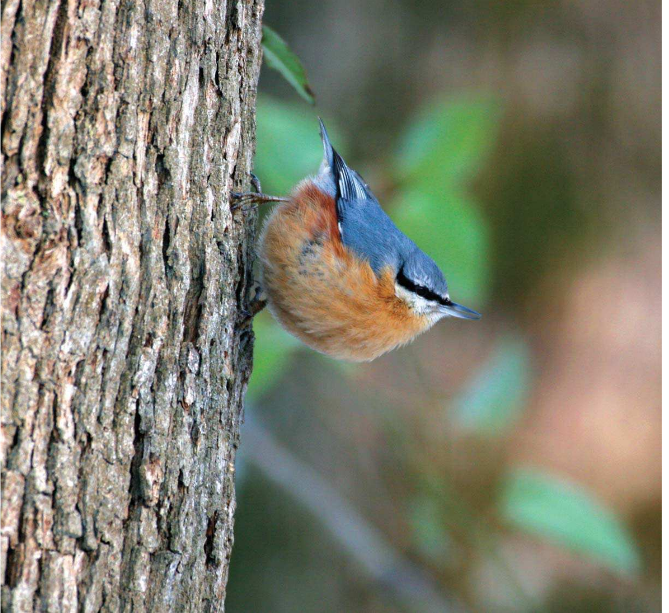
Sivacı (Sitta europea) © Oya Gökçen, Muzaffer Gökçen