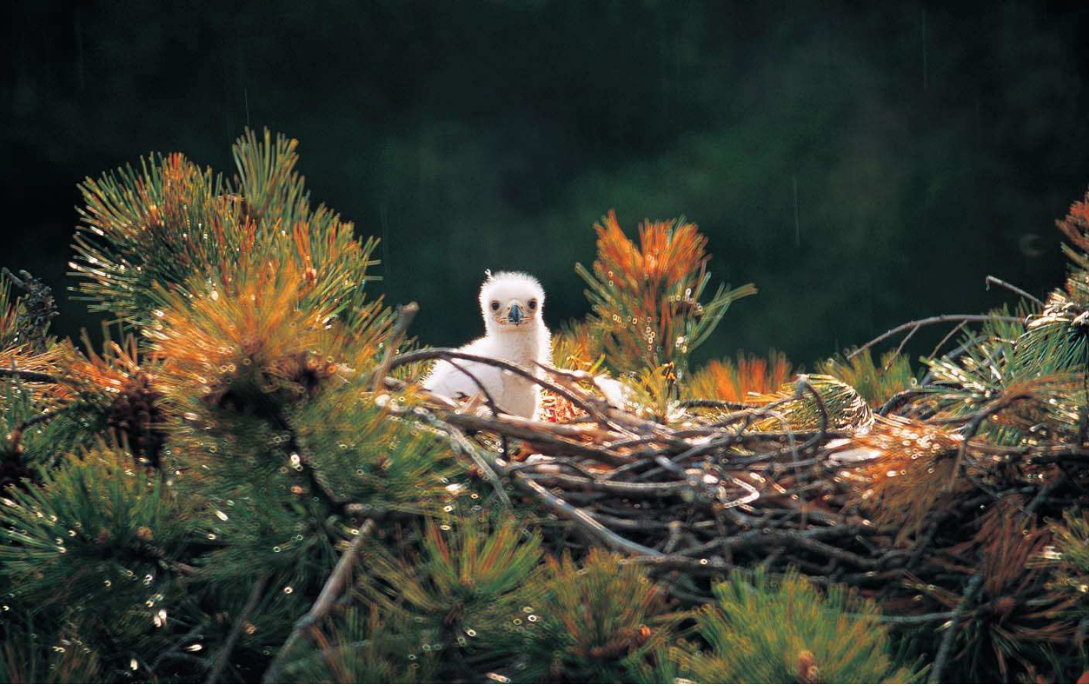
Şah kartal ( Aquila heliaca )

Yüzölçümü : 5208 ha Boylam : 32,91°D Enlem : 39,66°K Koruma Statüleri : Doğal sit alanı, muhafaza ormanı Yükseklik : 1120 m - 1521 m İl(ler) : Ankara İlçe(ler) : Gölbaşı, Bala