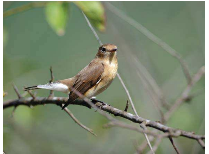
Küçük sinekkapan ( Ficedula parva ) © Özkan Üner