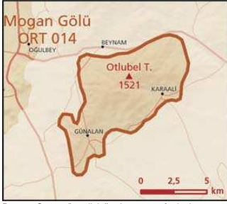
Beynam Ormanı önemli doğa alanı topografya haritası