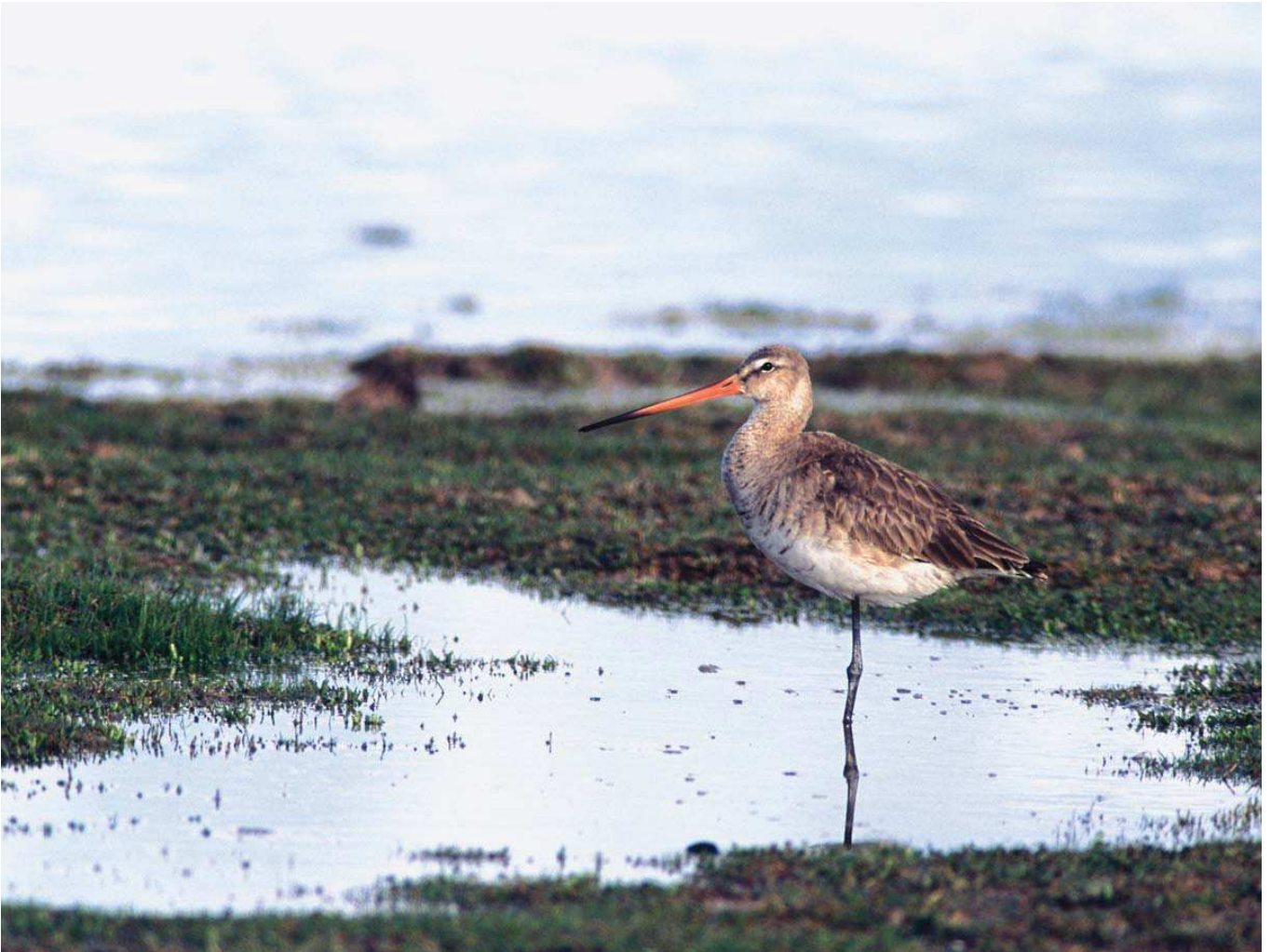
Çamurçulluğu ( Limosa limosa )