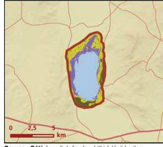
Çavuşçu Gölü önemli doğa alanı bitki örtüsü haritası