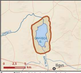
Çavuşçu Gölü önemli doğa alanı topografya haritası