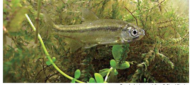
Pseudophoxinus anatolicus © Ahmet Karatas