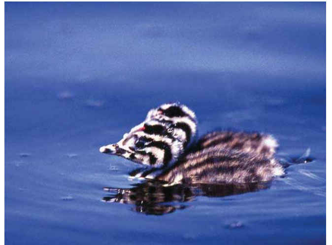
Bahri yavru (Podiceps cristatus)

■ Koruma Çalışmaları : Alanda bilinen bir koruma çalışması yoktur.