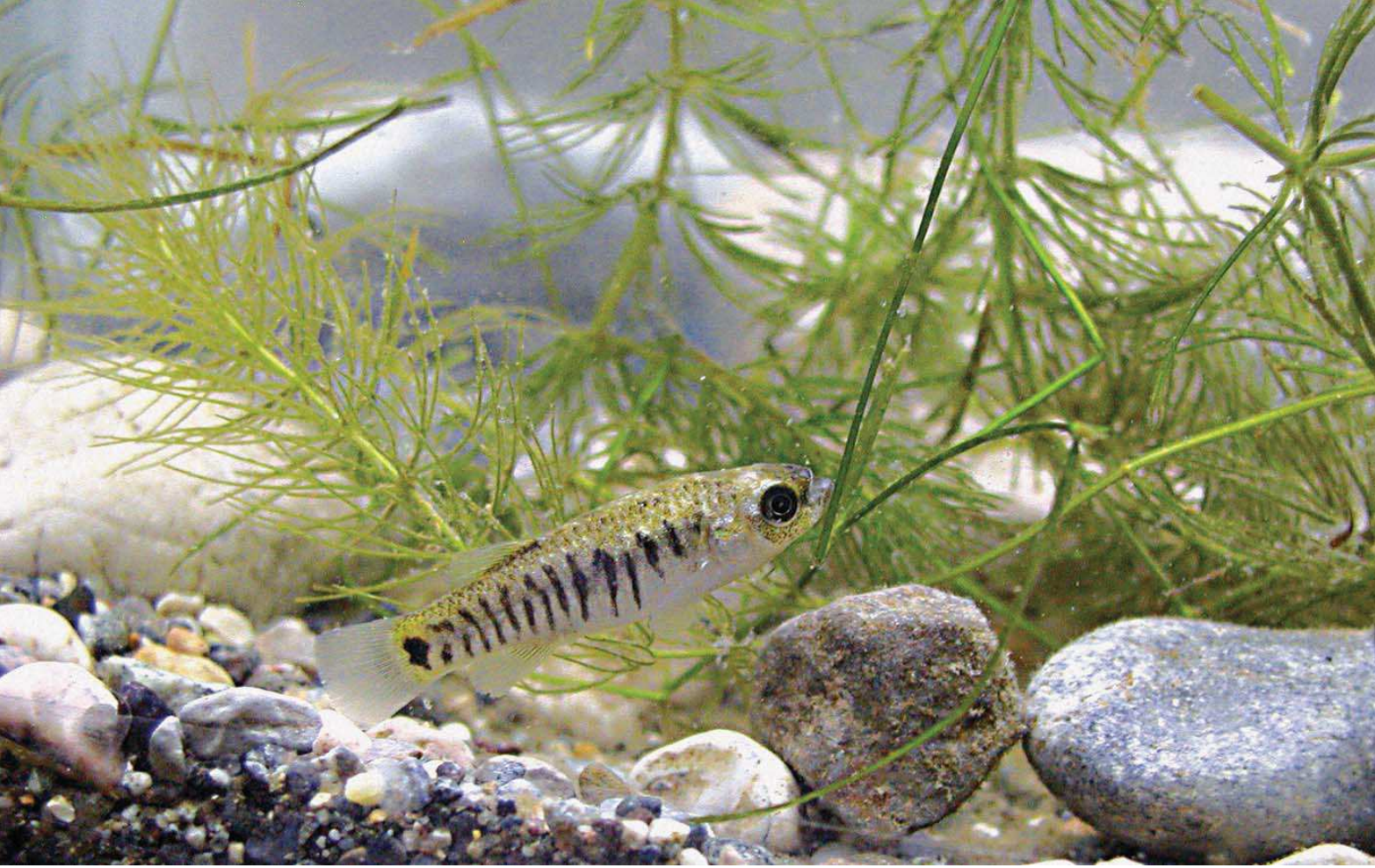
Aphanius villwocki

Yüzölçümü : 3123 ha Boylam : 31,88°D Enlem : 38,35°K Koruma Statüleri : Yok Yükseklik : 1020 m - 1110 m İl(ler) : Konya İlçe(ler) : Ilgın