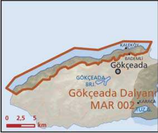
Gökçeada Kuzey Kıyıları önemli doğa alanı topografya haritası