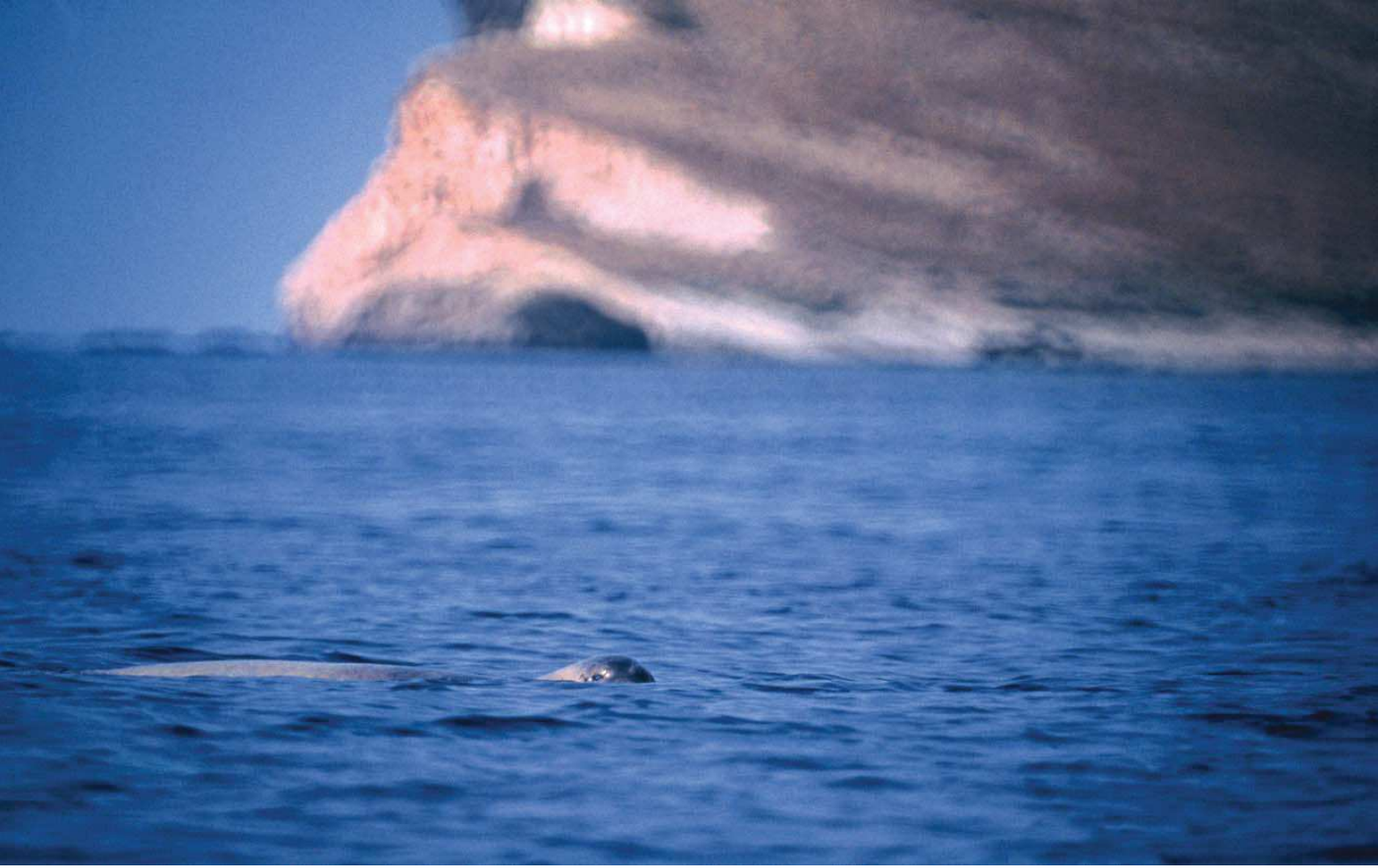
Akdeniz foku ( Monachus monachus )

Yüzölçümü : 6778 ha Boylam : 25,79°D Enlem : 40,20°K Koruma Statüleri : Yok Yükseklik : 0 m - 520 m il(ler) : Çanakkale ilçe(ler) : Gökçeada