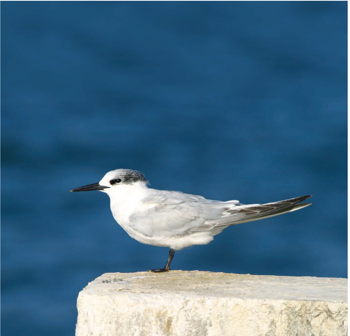
Kara gagalı sumru ( Sterna sandvicensis )