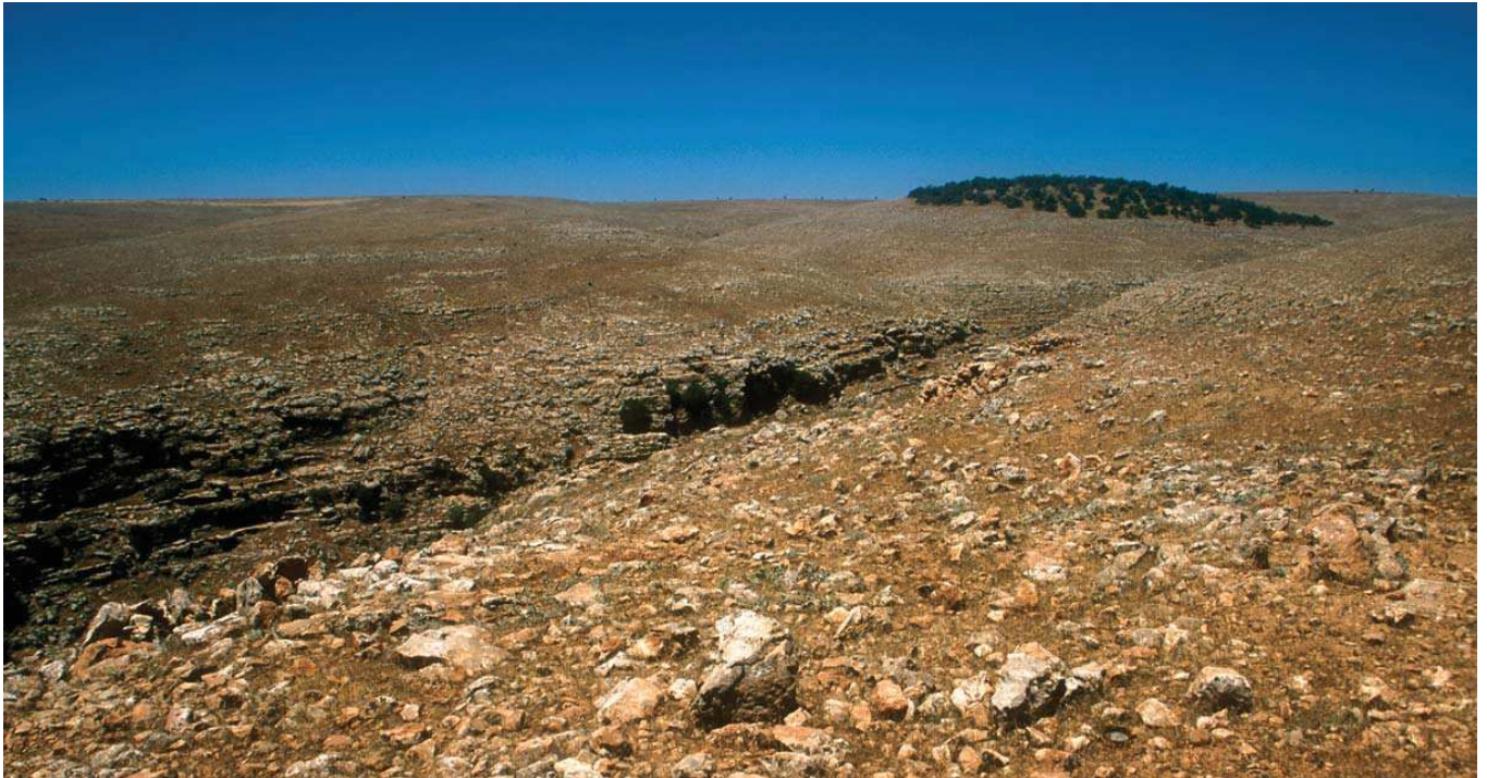
Küpeli Dağı © Hillary & Geoff Welch