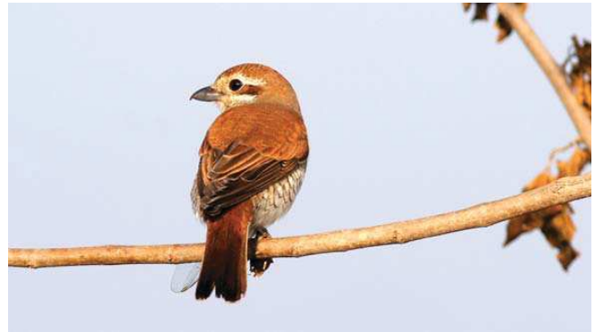
Kızılsu örümcekkuşu ( Lanius collurio )

■ Koruma Çalışmaları : İlisu Barajı projesinin iptal edilmesi için Doğa Derneği hem ulusal hem de uluslararası ölçekte çalışmalar gerçekleştirmektedir. Projenin iptali için Atlas dergisi ve Doğa Derneği ortak bir imza kampanyası yürütmektedir.