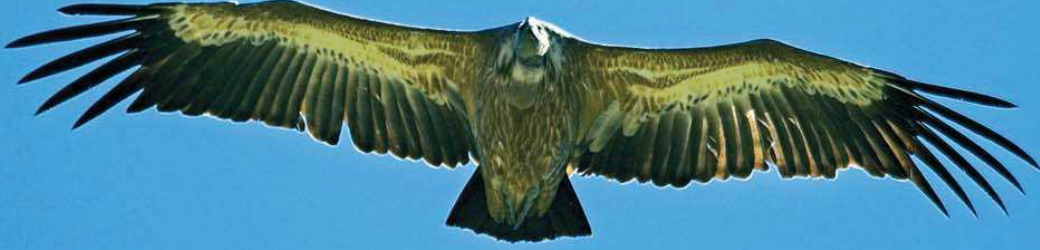
Kızıl akbaba ( Gyps fulvus )

Yüzölçümü : 96913 ha Boylam : 42,03°D Enlem : 37,51°K Koruma Statüleri : Yok Yükseklik : 380 m - 1848 m İl(ler) : Şırnak, Mardin, Siirt İlçe(ler) : Eruh, Şırnak merkez, Dargeçit, Güçlükonak, İdil, Cizre