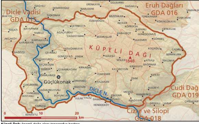
Küpeli Dağı önemli doğa alanı topografya haritası