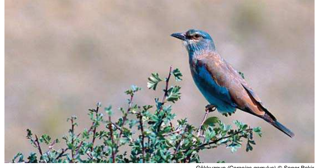
Gökkuzgun ( Coracias garrulus )