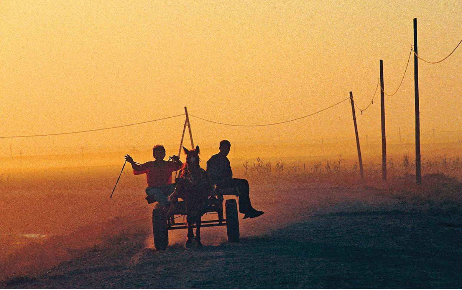
Harran Ovası

Yüzölçümü : 365 ha Boylam : 39,03°D Enlem : 36,87°K Koruma Statüleri : Arkeolojik sit alanı Yükseklik : 360 m - 390 m İl(ler) : Şanlıurfa İlçe(ler) : Harran