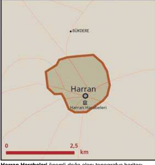
Harran Harabeleri önemli doğa alanı topografya haritası