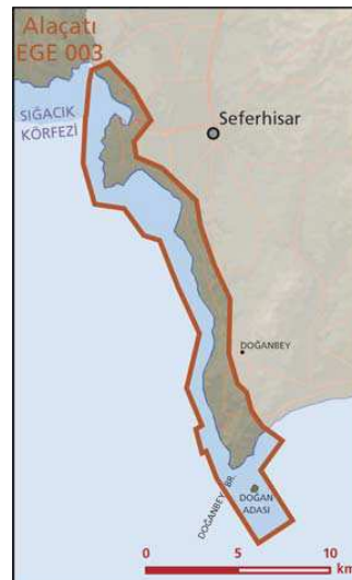
Doğanbey Kıyıları önemli doğa alanı topografya haritası