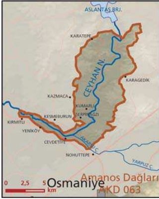
Kastabala Vadisi önemli doğa alanı topografya haritası