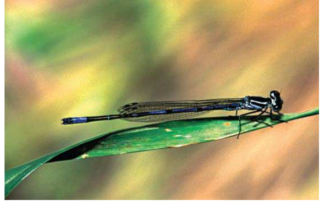
Coenagrion syriacum