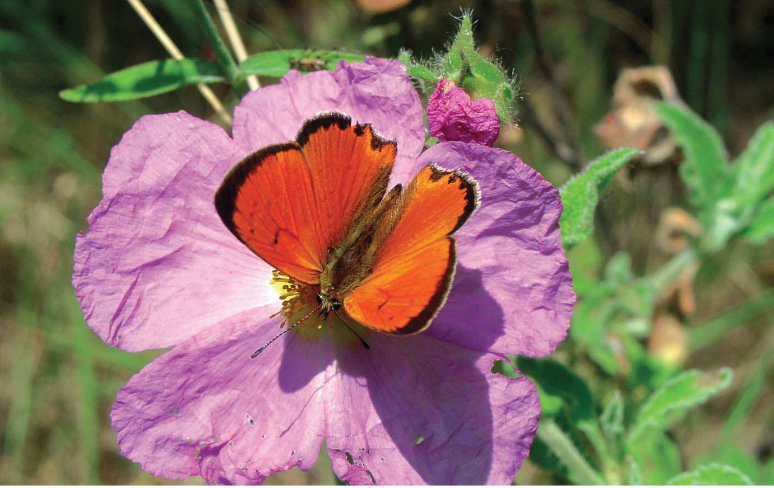
Osmanlı ateşi ( Lycaena ottomana )

Yüzölçümü : 7392 ha Boylam : 32,05°D Enlem : 36,66°K Koruma Statüleri : Yok Yükseklik : 175 m - 1640 m il(ler) : Antalya ilçe(ler) : Gündoğmuş, Alanya