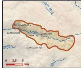
Kargı Çay Vadisi önemli doğa alanı topografya haritası

■ Koruma Çalışmaları : Alanda bilinen bir koruma çalışması yoktur.