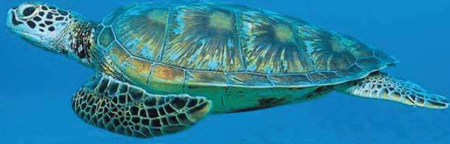
Deniz kaplumbağası (Caretta caretta)

Yüzölçümü : 45372 ha Boylam : 28,78°D Enlem : 36,72°K Koruma Statüleri : Özel çevre koruma bölgesi, doğal sit alanı