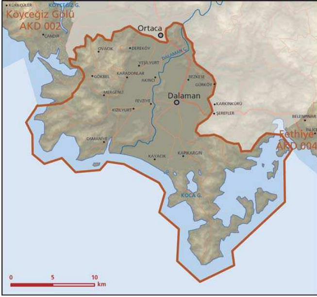
Dalaman Ovası önemli doğa alanı topografya haritası