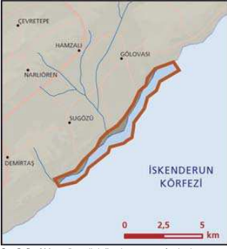
Sugözü - Akkum önemli doğa alanı topografya haritası