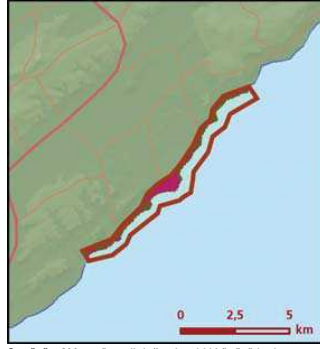
Sugözü - Akkum önemli doğa alanı bitki örtüsü haritası