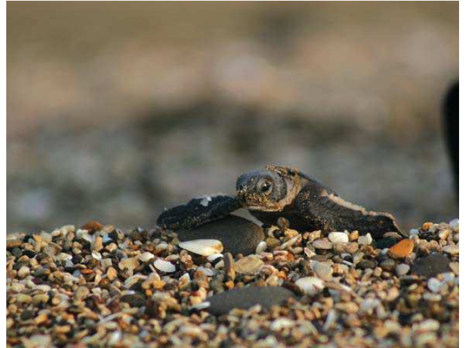
Yeşil deniz kaplumbağası ( Chelonia mydas )