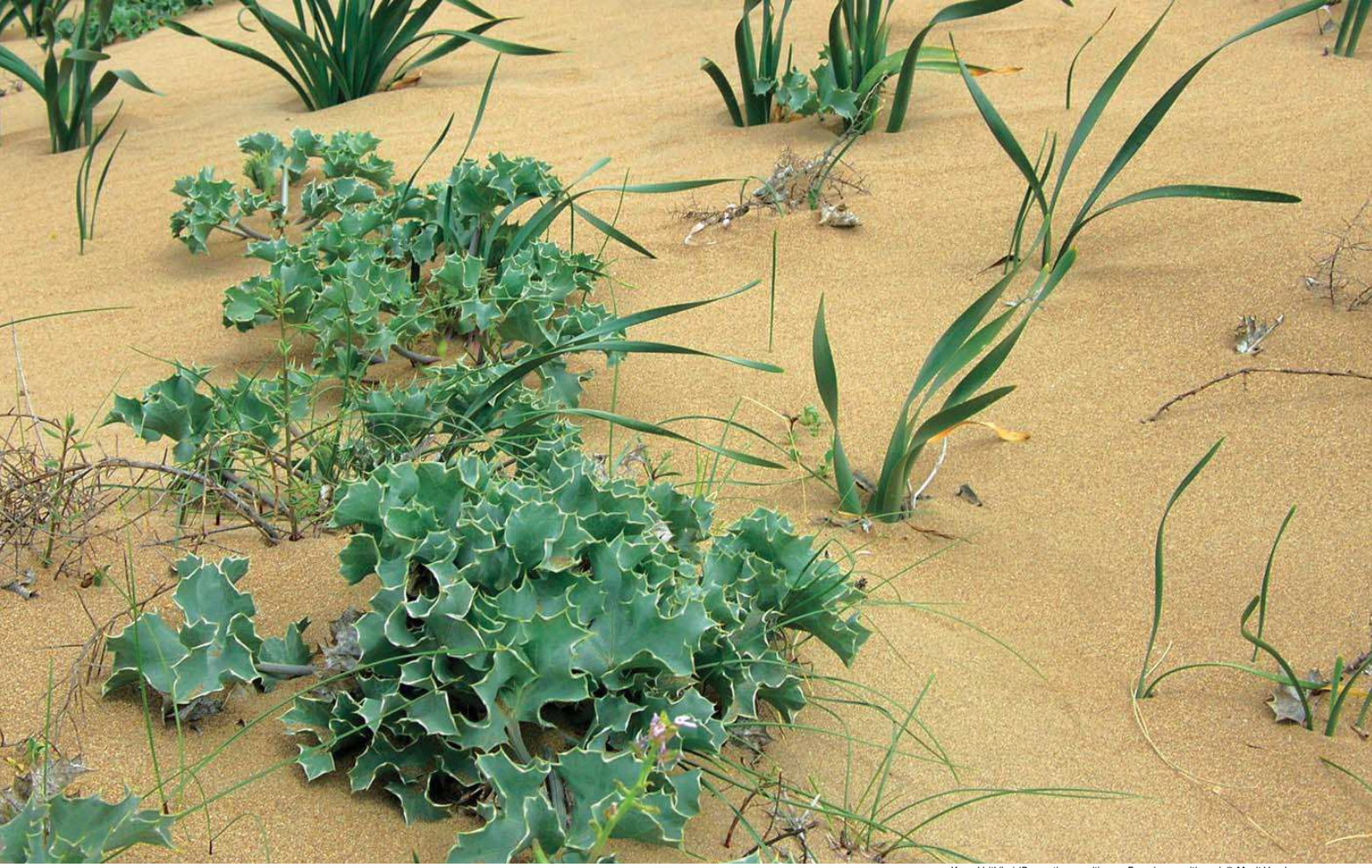
Kumul bitkileri ( Panicum maritimum , Eryngium maritimum )

Yüzölçümü : 851 ha Boylam : 35,89°D Enlem : 36,85°K Koruma Statüleri : Yok Yükseklik : 0 m - 33 m İl(ler) : Adana İlçe(ler) : Yumurtalık