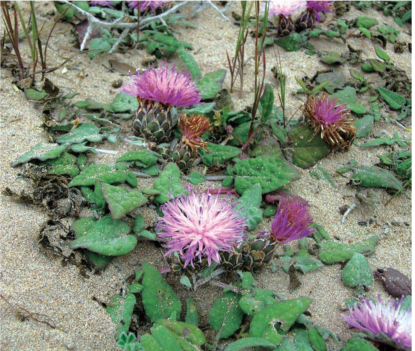
Centaurea aegialophila