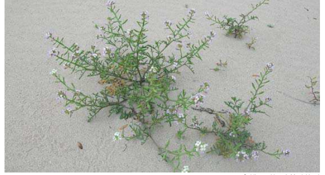
Cakile maritima